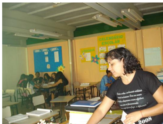
PRAEC Horta Escolar e Sala Ambiente – Sto. Antonio do Descoberto